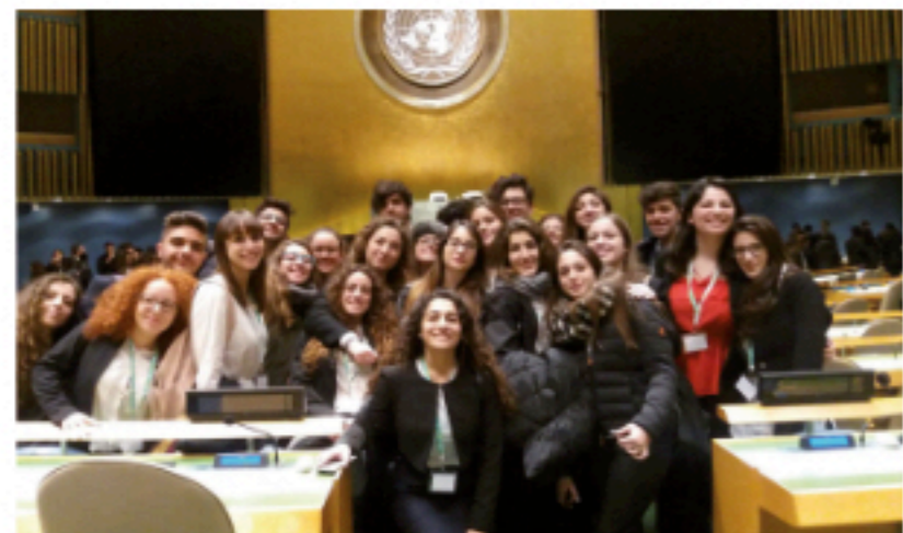
PCTO MUN NEW YORK

L'attività semiconvittuale prevede, per ogni classe, la presenza di personale educativo specializzato: una figura professionale di fondamentale importanza che durante le ore pomeridiane segue gli studenti nello studio, nella socializzazione e nella crescita individuale e di gruppo. Il Convitto è riservato alle ragazze che sono costantemente seguite dal personale educativo.